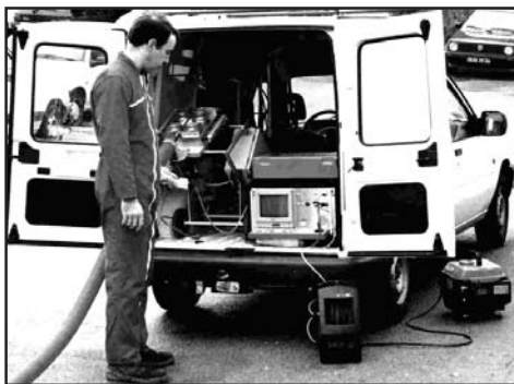
Télé-inspection de la canalisation Teleinspecting the pipe