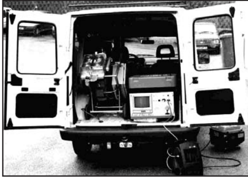
Mise en place du véhicule Positioning the vehicle

Système d'inspection TV avec ombilical semi-rigide motorisé TV inspection system with motorized semi rigid cable