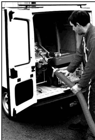
Fixation du tube guide Anchoring the guiding tube