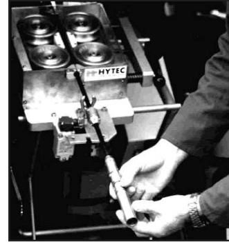
Connexion de la caméra Connecting the TV camera