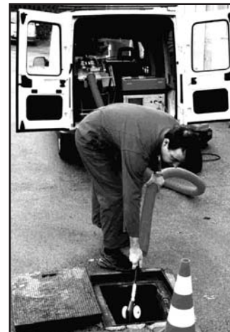
Introduction de la caméra et du tube guide Inserting the camera and guiding tube